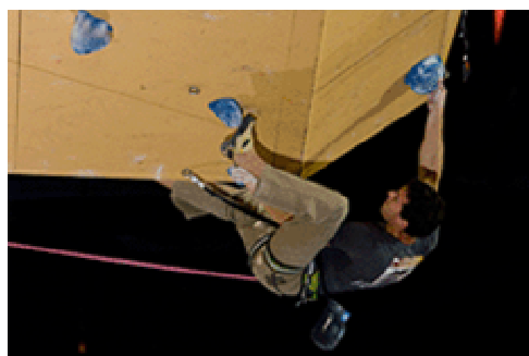
Bloc - Difficulté - Vitesse.